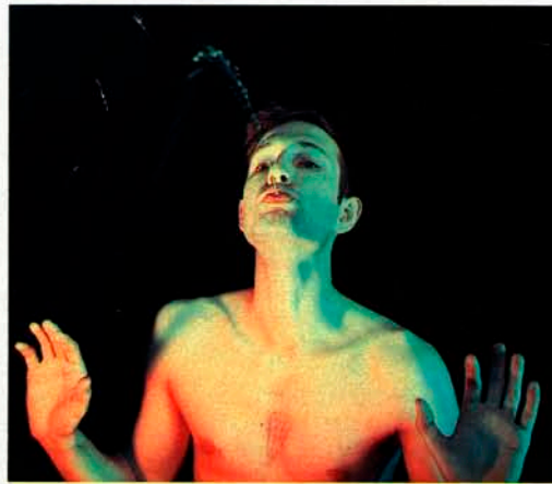
Verbläutes Nauman-Bild (u.), Urzustand (o.) Weniger Gelb macht Blau